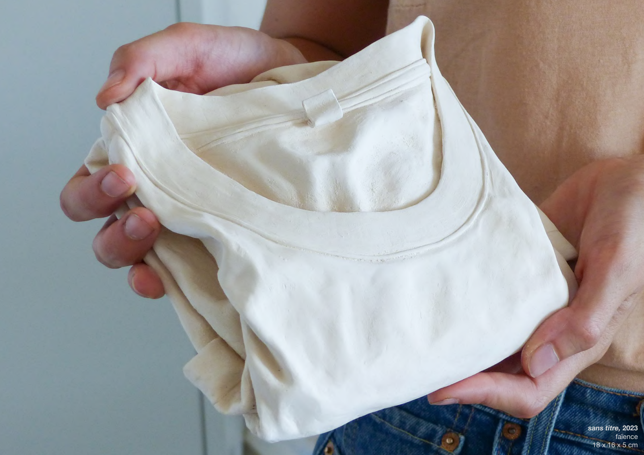
sans titre , 2023 faïence 18 x 16 x 5 cm