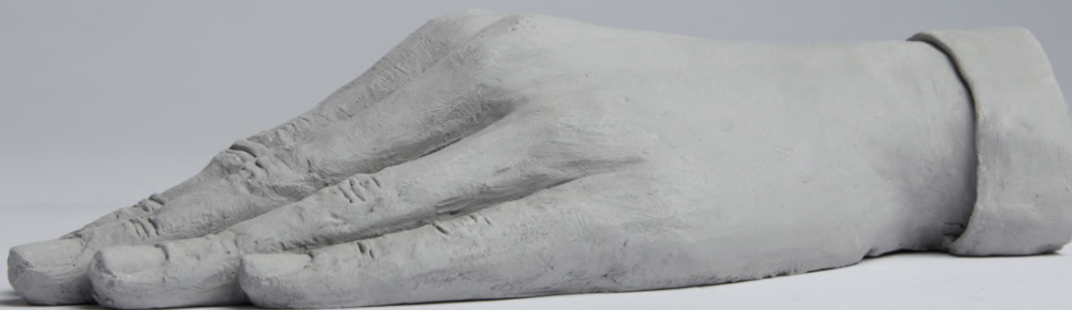
sans titre , 2023 grès 21 x 10 x 5 cm