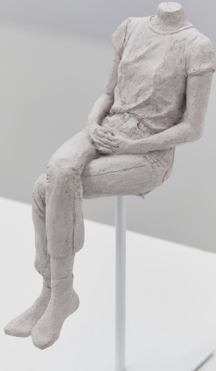
sans titre , 2023