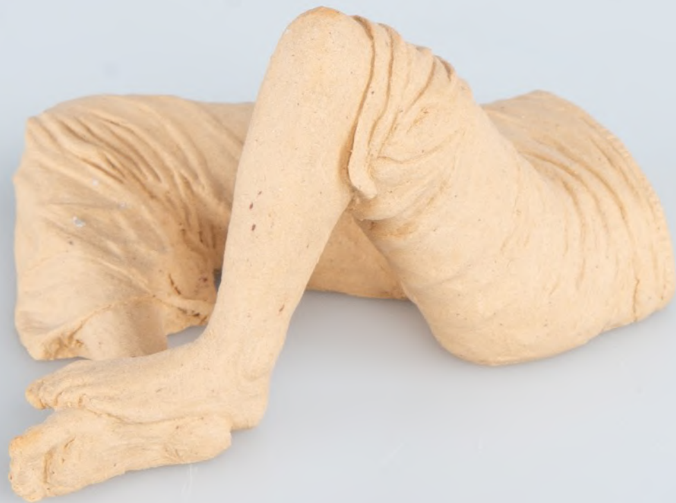
sans titre, 2022 grès 8 x 5 cm