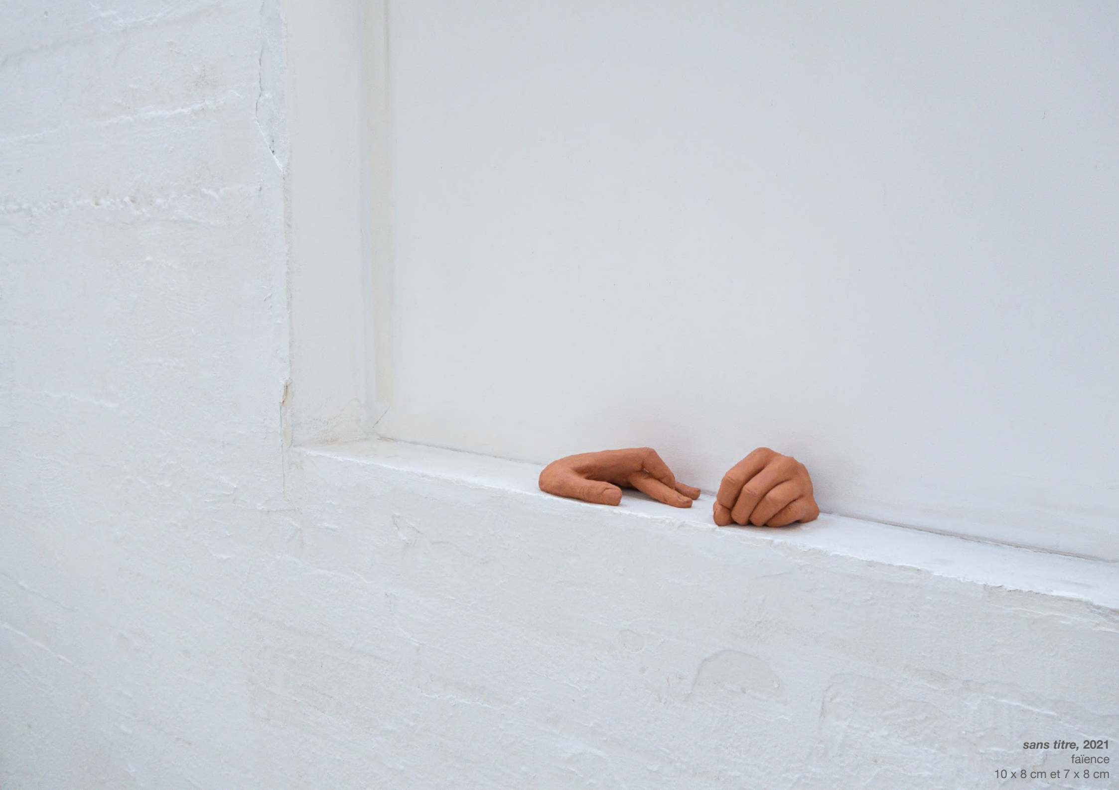
sans titre, 2021