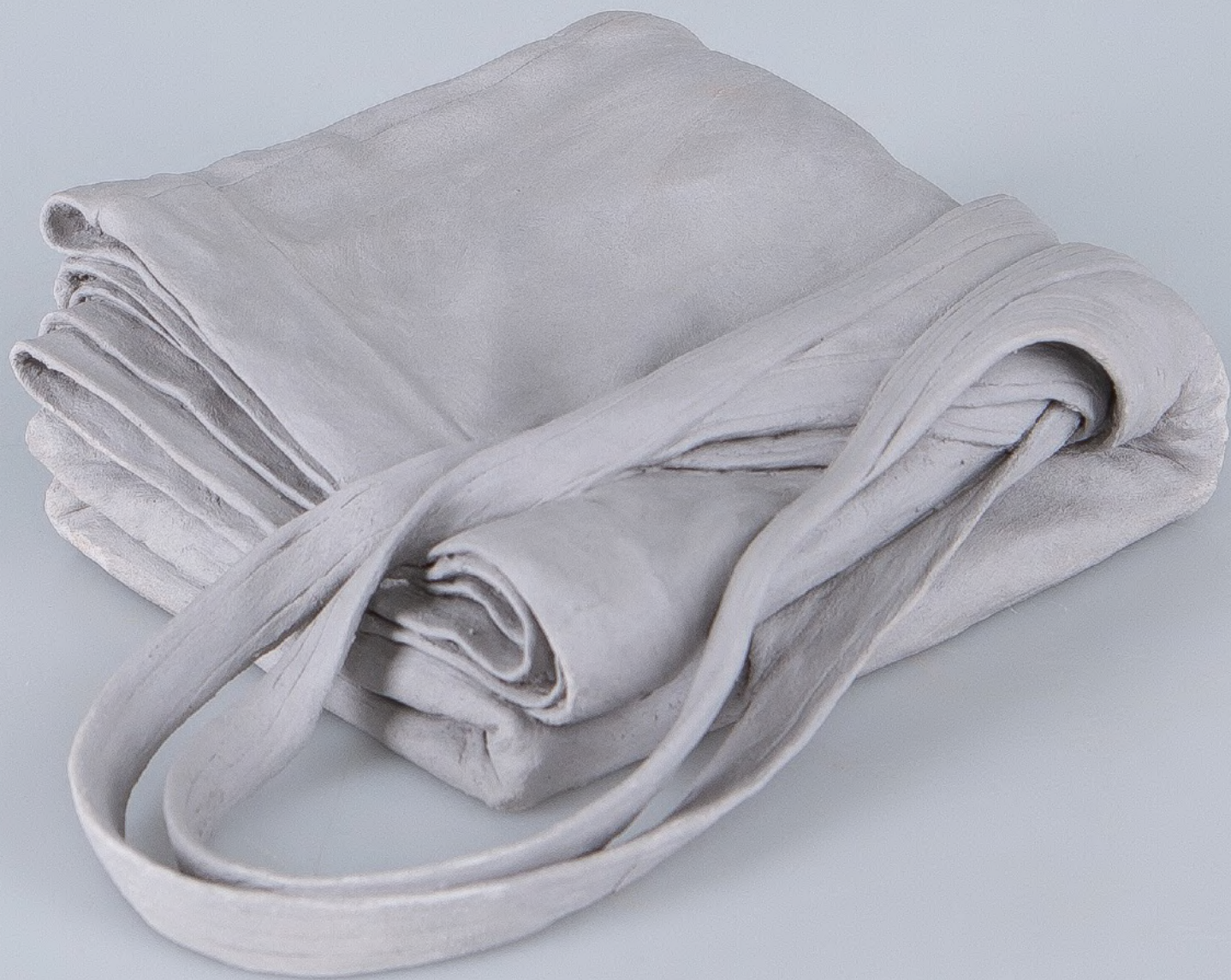
sans titre , 2023 grès 12 x 17 x 5 cm