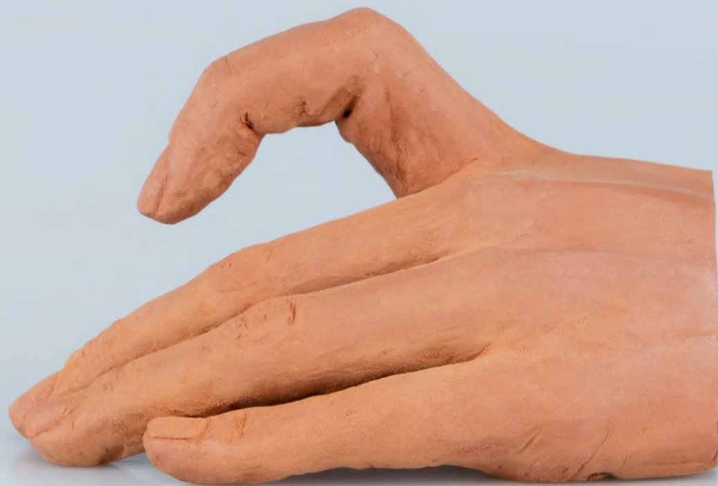
sans titre , 2021 faïence 10 x 8 cm