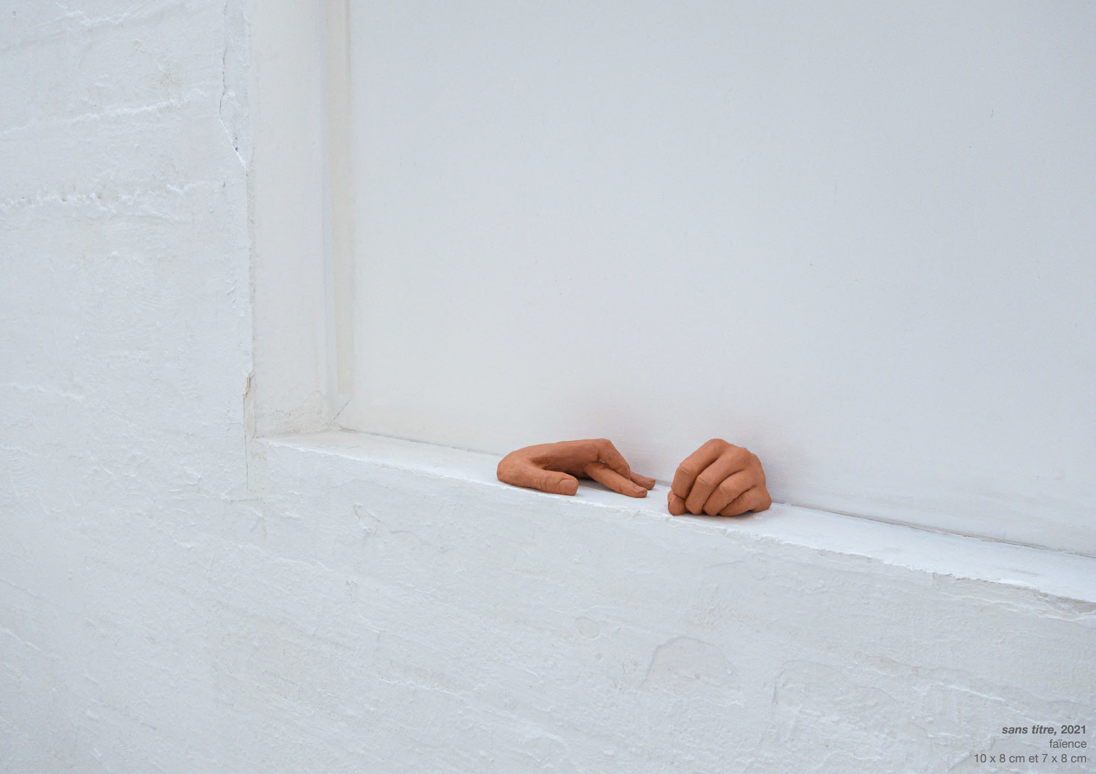
sans titre, 2021