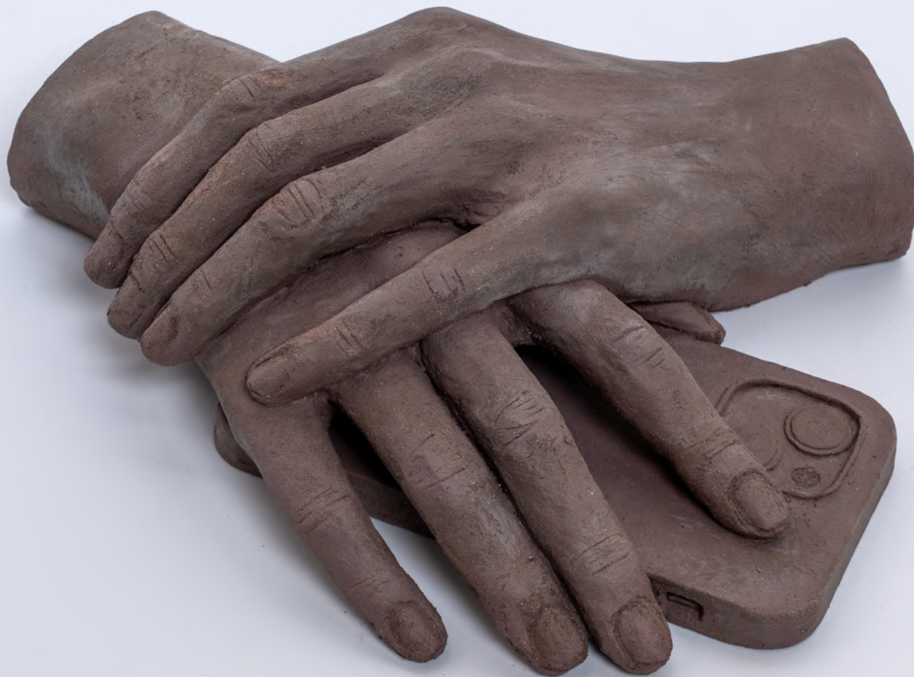
sans titre , 2025 céramique 21 x 17 x 5,5 cm