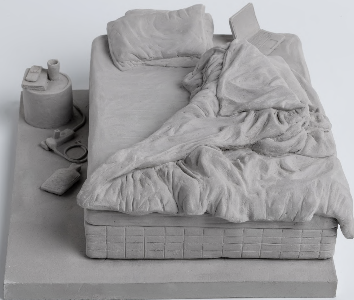
sans titre , 2025 grès 17 x 18 x 8 cm