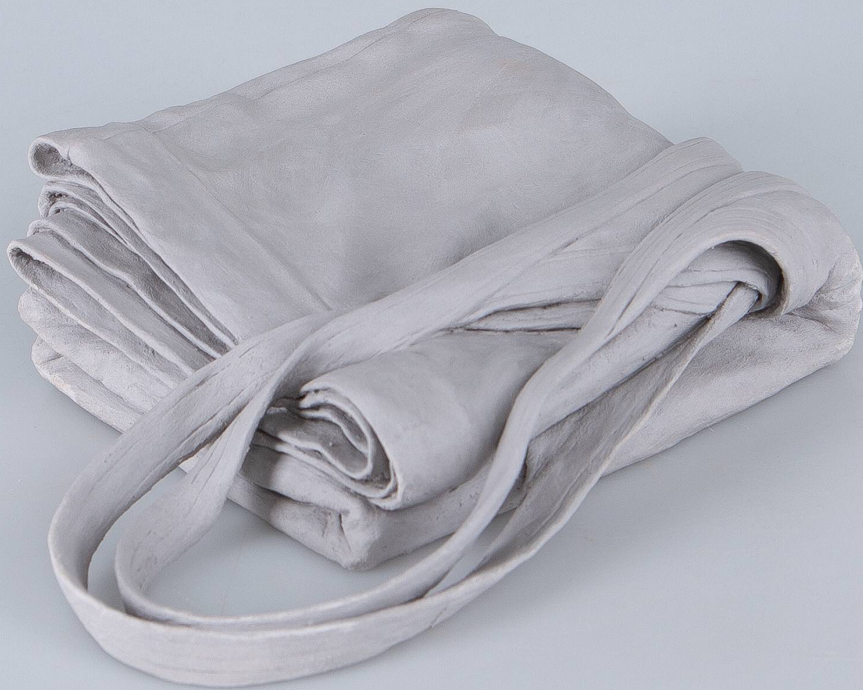
sans titre , 2023 grès 12 x 17 x 5 cm