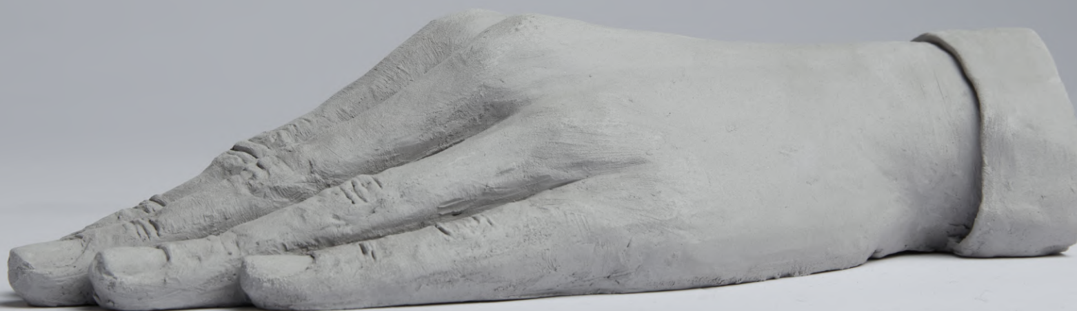
sans titre , 2023 grès 21 x 10 x 5 cm