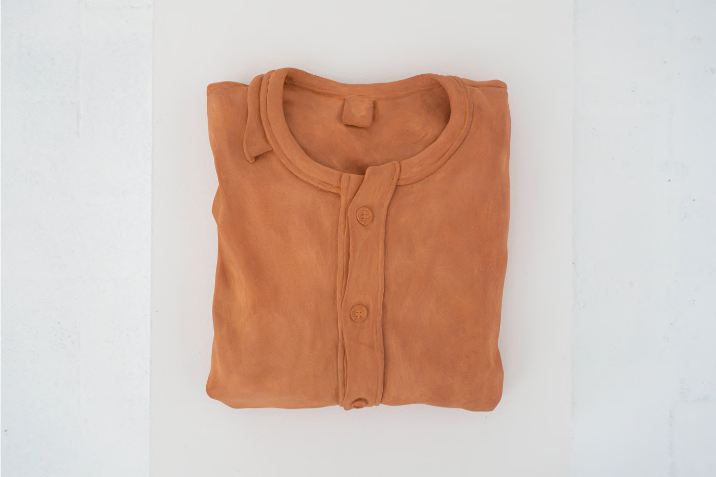
sans titre, 2022 faïence 30 x 23 x 4 cm