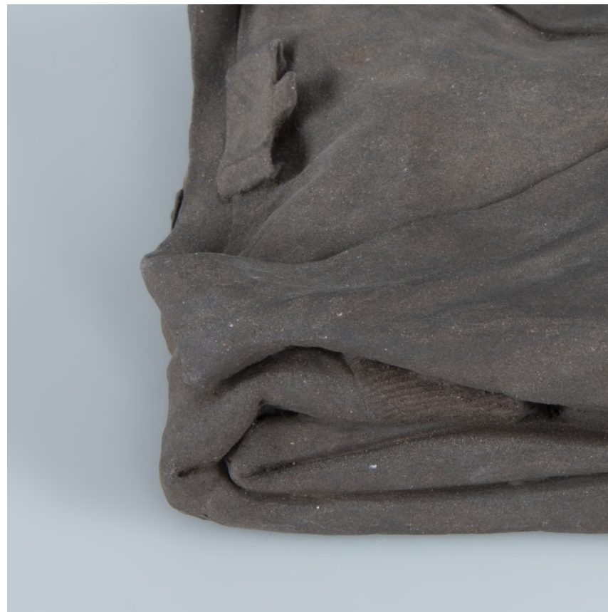
sans titre , 2021 grès 10 x 9 cm