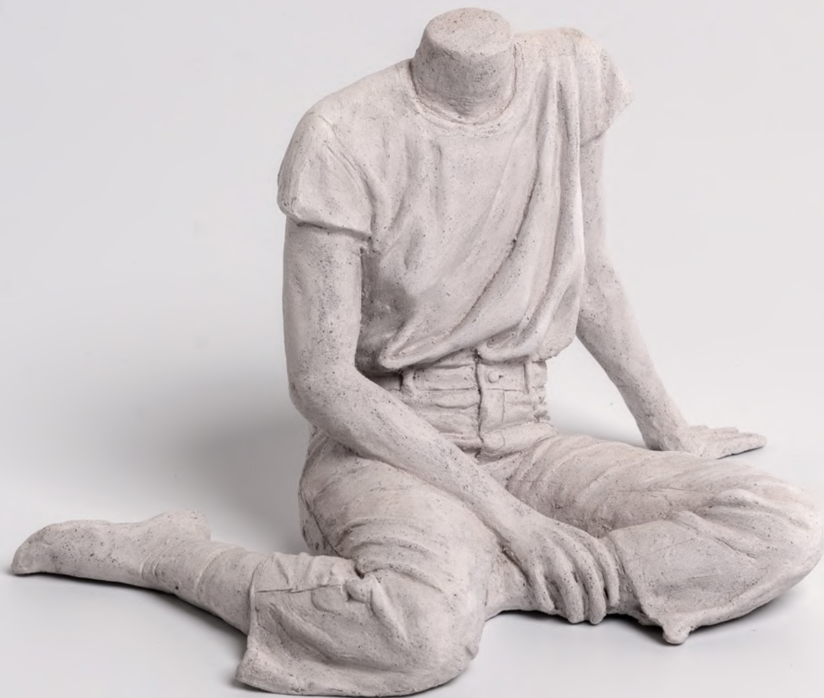
sans titre , 2025 grès 15 x 10 x 9 cm