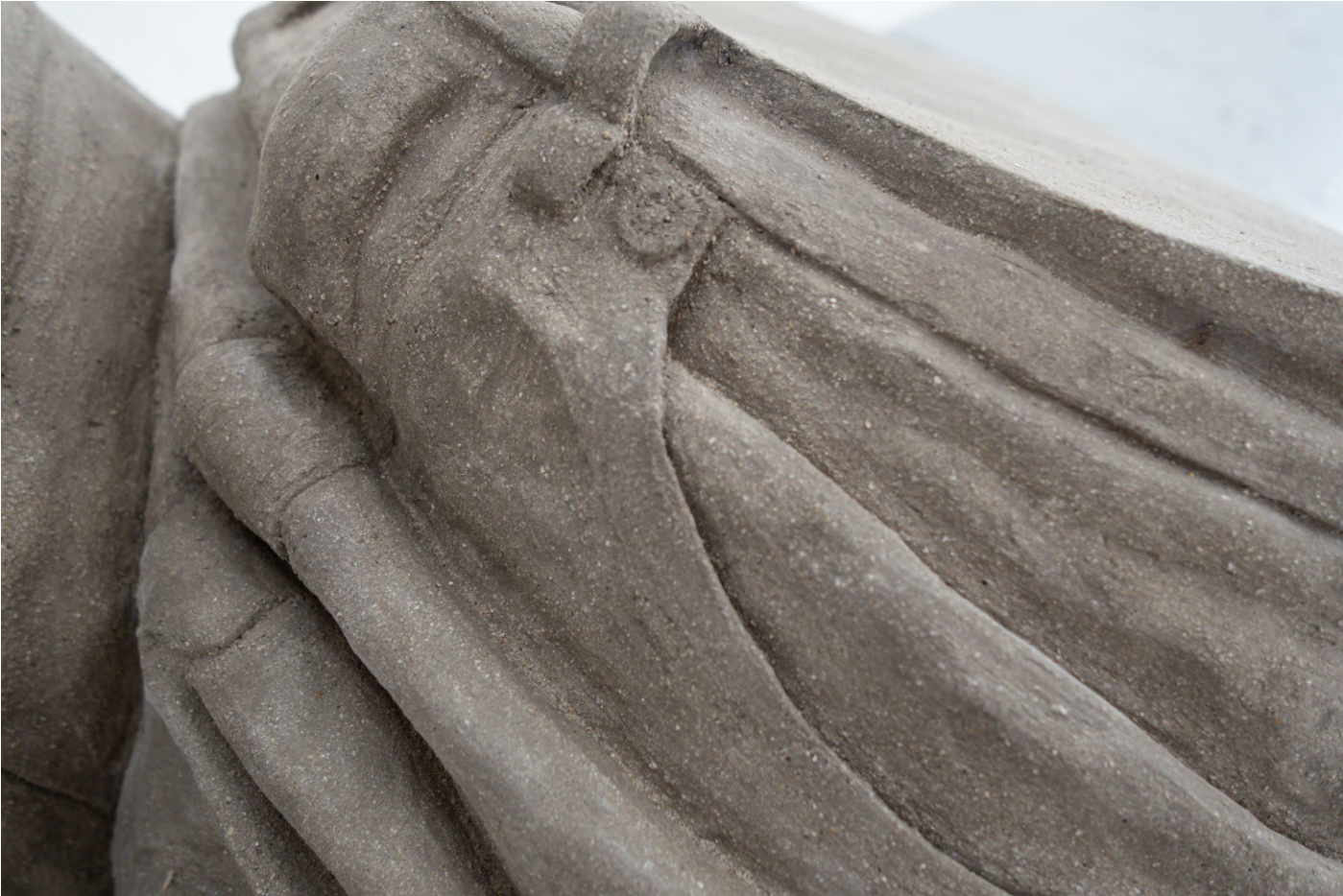
sans titre , 2022 grès 51 x 65 x 45 cm