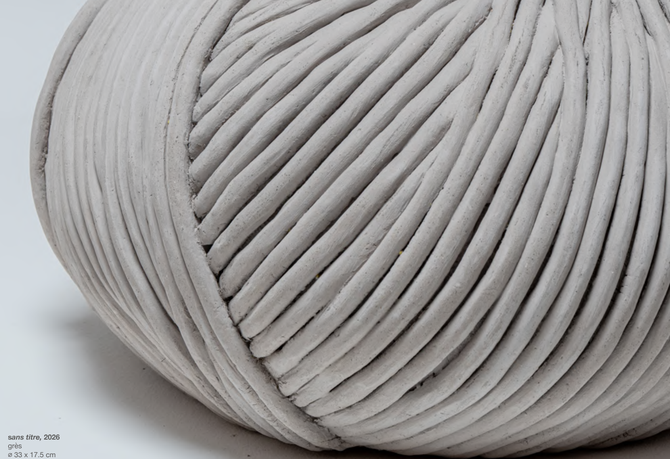
sans titre, 2026 grès ø 33 x 17.5 cm