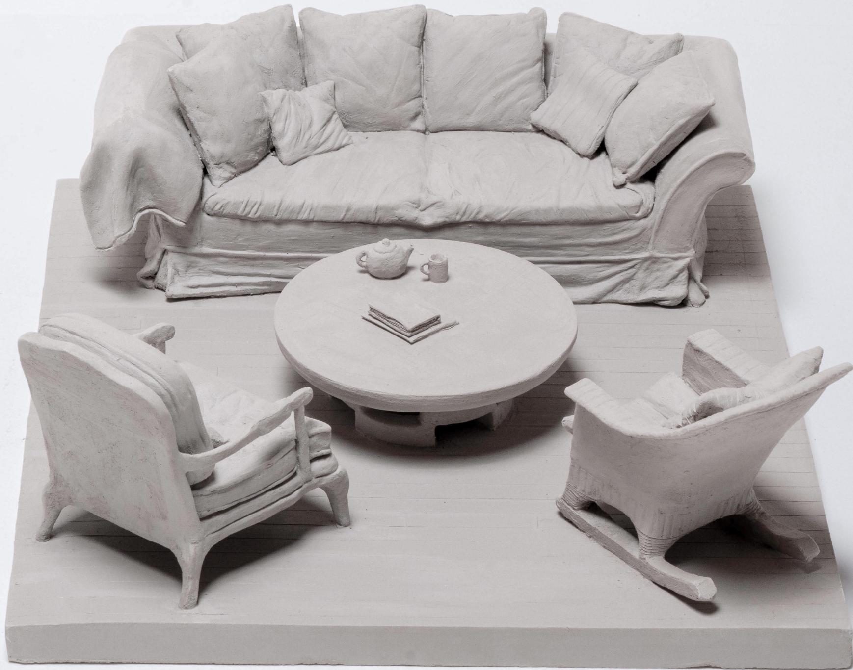
sans titre , 2025 céramique 21 x 17 x 5,5 cm